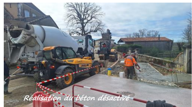
Réalisation du béton désactivé