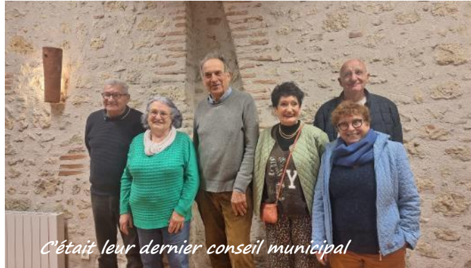
C'était leur dernier conseil municipal