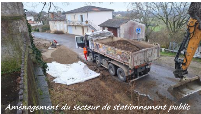
Aménagement du secteur de stationnement public

Les quatre vieux tilleuls fatigués et aux troncs creux ont dû être abattus par l'entreprise d'élagage SOUBIRON. Sur cette section, s'il ne subsiste qu'un vénérable tilleul, un autre plus jeune et un vieux