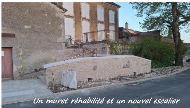
Un muret réhabilité et un nouvel escalier

HAVERLAND, chef des travaux. Travaillant dans le flux de circulation, ces ouvriers doivent parfois supporter des incivilités et le comportement peu respectueux, de quelques automobilistes.