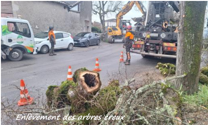
Enlèvement des arbres creux

Les travaux d'aménagement et de sécurisation de la traversée du bourg de Moirax ont débuté le 26 janvier dernier.