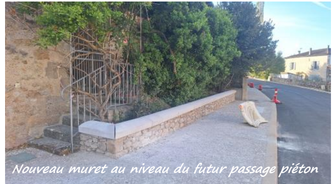
Nouveau muret au niveau du futur passage piéton

principaux sont de sécuriser les accès, les déplacements piétons, de réorganiser les stationnements, d'aménager le « tour de ville » de manière qualitative, de mettre en valeur les deux entrées de bourg et à terme (seconde tranche) de relier le centre historique aux équipements sportifs et de loisirs.