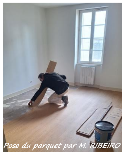
Pose du parquet par M. RIBEIRO

surface de 130m 2 sur deux niveaux avec trois chambres à l'étage. Il sera libre et remis en location courant de ce 2 ème trimestre 2026.