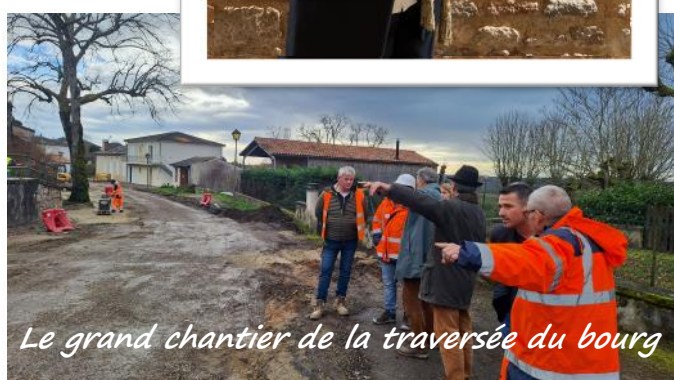
Le grand chantier de la traversée du bourg