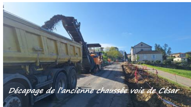
Décapage de l'ancienne chaussée voie de César

Il a été également décidé, hors marché, de refaire l'entrée du cimetière pour des raisons de sécurité et d'esthétique. Le portail sera rénové et de nouveaux piliers installés plus en retrait.