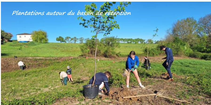
Plantations autour du bassin de rétention

Il y a fort à parier que les volontaires seront légions pour s'inscrire au chantier d'été du 6 au 10 juillet prochain.