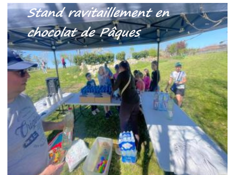
Stand ravitaillement en chocolat de Pâques

plastiques multicolores sous la surveillance de leurs parents ou grands-parents. Les œufs, une fois ramassés, étaient échangés contre leurs équivalents en chocolat bien plus intéressants et appétissants.