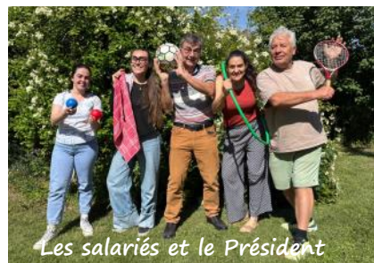
Les salariés et le Président

Notre mission est de favoriser, via l'improvisation clown, la rencontre entre les personnes en situation de handicap et les enfants adolescents adultes, d'horizons divers. Nombreux sont les enfants de Moirax qui ont pu