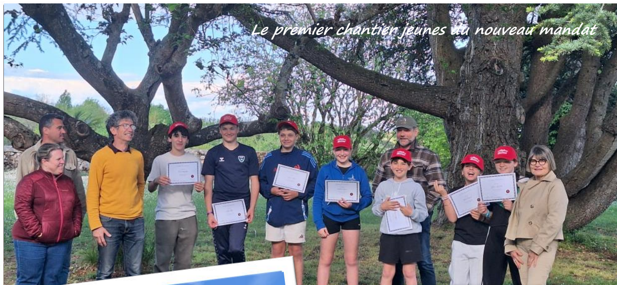
Le premier chantier jeunes du nouveau mandat