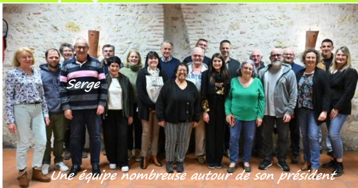
Une équipe nombreuse autour de son président