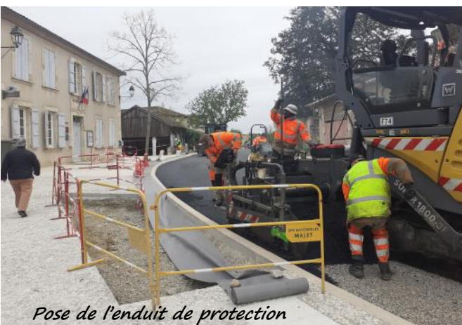
Pose de l'enduit de protection

Le coût de ces travaux d'ampleur s'élève à 582 580.16€ HT et ont été subventionnés à près de 80%. Ils contribueront à la mise en valeur du village avec l'aménagement du « tour de ville ». Les objectifs