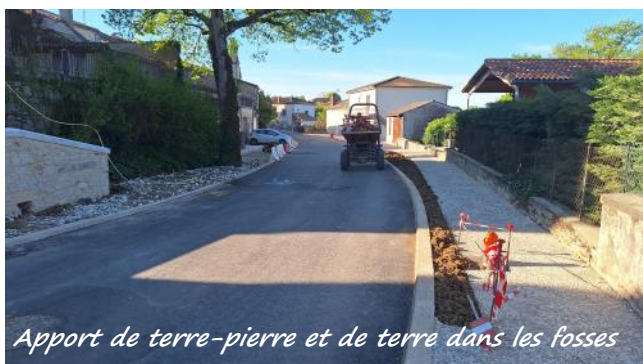
Apport de terre-pierre et de terre dans les fosses

Au final, les travaux entre la rue de l'école et la Vierge sont très avancés et le planning devrait être respecté. Les travaux de décapage, de terrassement et de purge ont été réalisés en demi-chaussée afin de maintenir la circulation alternée pendant leur déroulement. Les bordures sont posées ainsi que les trottoirs en béton désactivé, qui