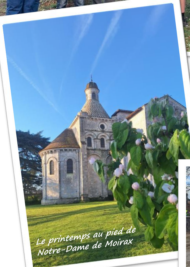
Le printemps au pied de Notre-Dame de Moirax