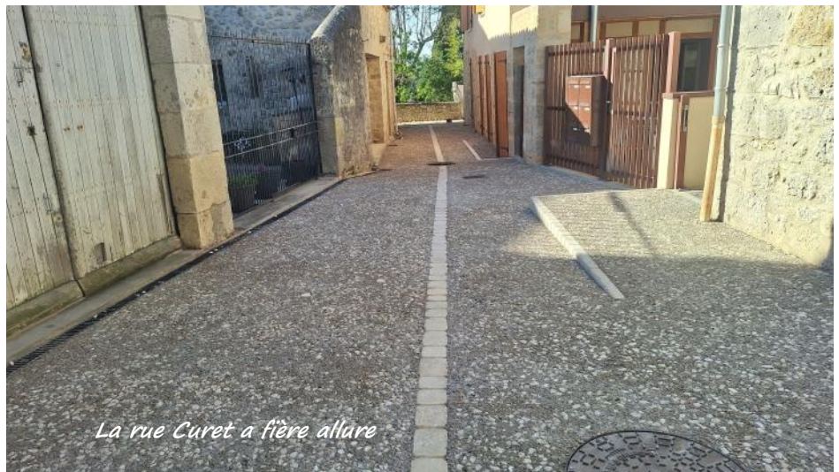
La rue Curet a fière allure

Profitant des travaux du bourg réalisés par l'entreprise ESBTP , la municipalité a commandé à cette dernière la réalisation d'un béton désactivé identique à celui de la Grand rue et du reste du village. Des riverains ont profité de la présence de cette société pour faire réaliser à leurs frais des revêtements similaires.