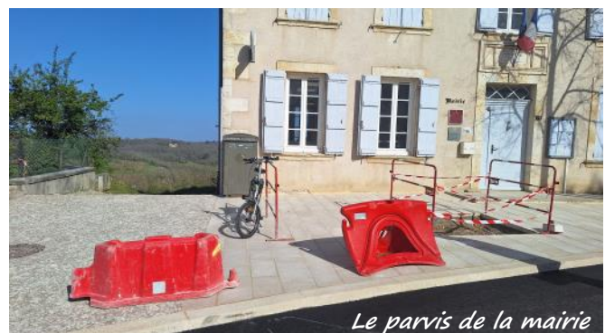
Le parvis de la mairie