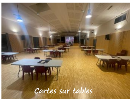
Cartes sur tables

Une nouvelle édition du concours de belote s'est tenue dans