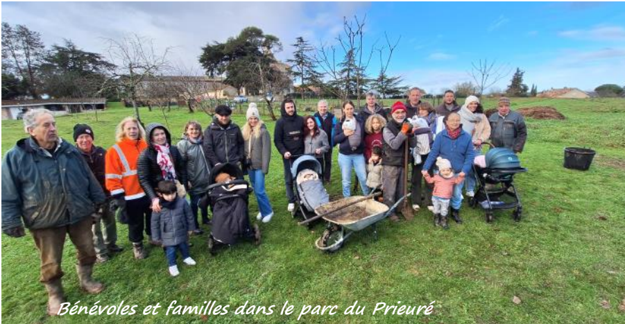
Bénévoles et familles dans le parc du Prieuré

L'opération, un enfant un arbre qui en est à sa cinquième édition, s'est déroulée le samedi 10 janvier.